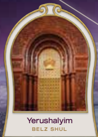
Yerushalayim BELZ SHUL