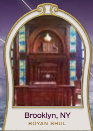
Brooklyn, NY BOYAN SHUL