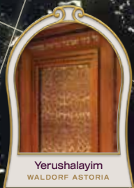
Yerushalayim WALDORF ASTORIA