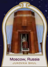
Moscow, Russia JUKOVKA SHUL