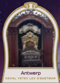
Antwerp KEHAL YETEV LEV D'SASTMAR