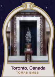
Toronto, Canada TORAS EMES