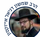
הרב שמשון דניאל "Jewmala" Еврейская Община Молдовы Тора: Pazum vs Mustruka (RU)