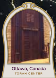
Ottawa, Canada TORAH CENTER