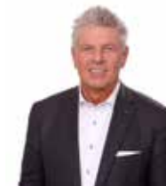
Landeshauptstadt München Oberbürgermeister

CEO der BayWa AG und Präsident der Industrie- und Handelskammer für München und Oberbayern