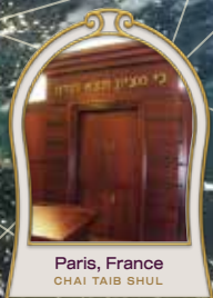
Paris, France CHAI TAIB SHUL