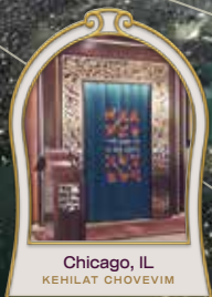
Chicago, IL KEHILAT CHOVEVIM