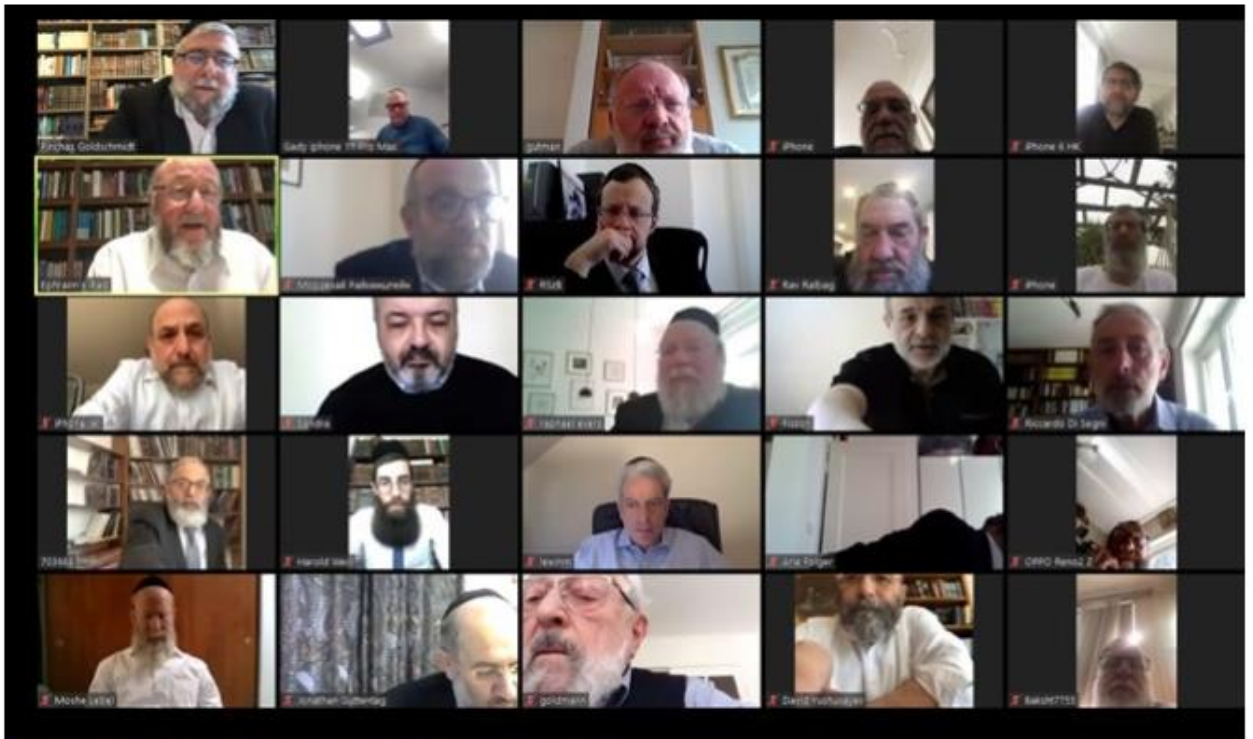
Conference of European Rabbis Zoom meeting