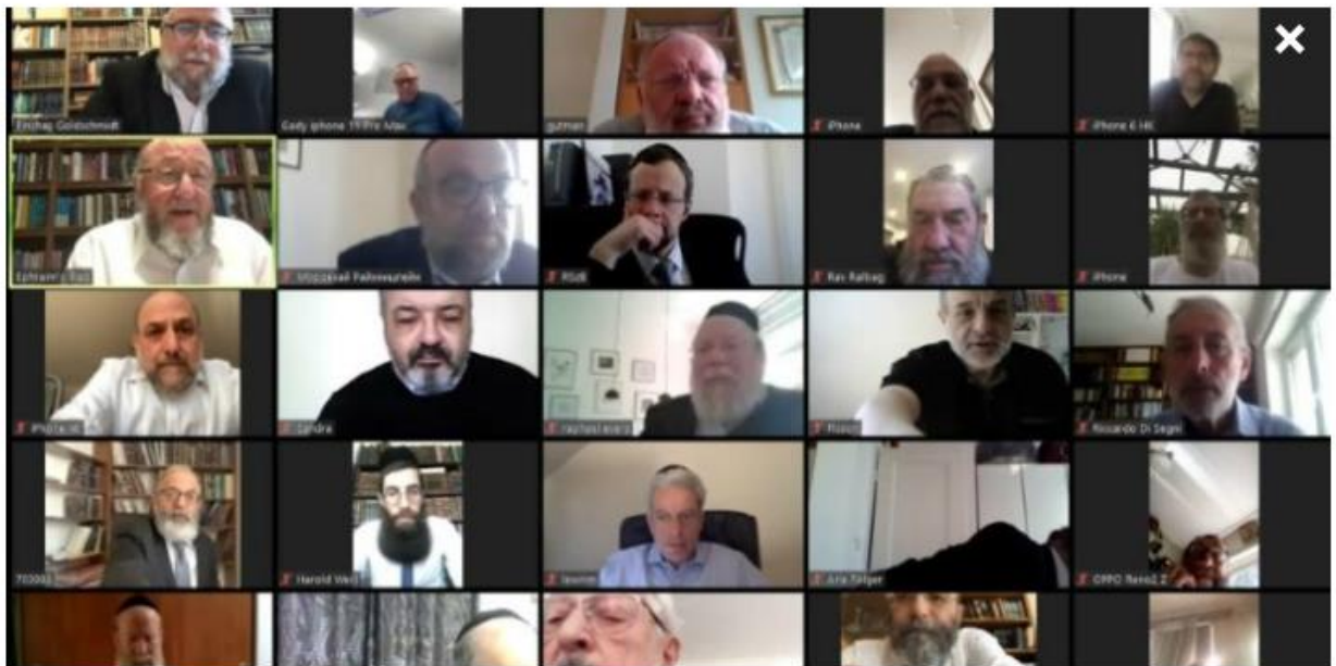
The Zoom meeting organized by the Conference of European Rabbis on Sunday, April 5, 2020. Photo: Screenshot.