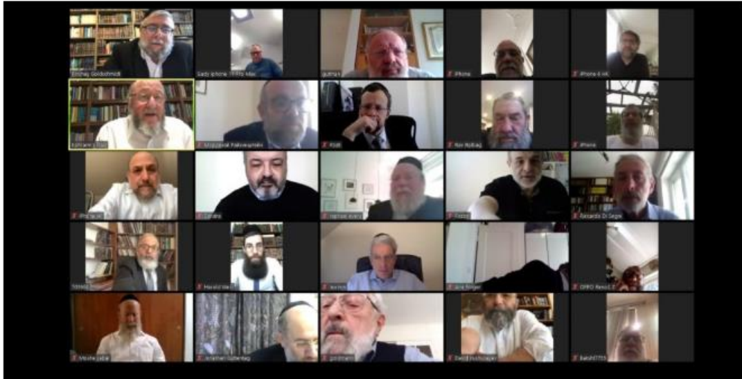
צילום מסך מתוך שיחה של ועידת רבני אירופה ב-זום

בקהילות היהודית באירופה נערכים לחנוג את פסח וליל הסדר בצל הקורונה והרבנים מנסים להתמודד ולתת מענה למצב הייחודי שנוצר. השאלות שמגיעות לפתחם לעיתים מורכבות ודרמטיות מהשאלות איתם מתמודדים הרבנים בארץ כיוון שמדובר לעיתים בקהילות קטנות, או באזורים שהנגיף יותר מתפשט בהן.