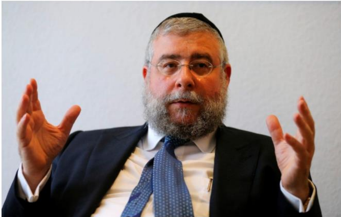
הרב פנחס גולדשמידט, נשיא ועידת רבני אירופה.

בשיחה עם מקור ראשון אמר הרב גולדשמידט, "ניסינו להבין האם ישנם דוגמאות קונקרטיות לכך שבמהלך ברית מילה מוהל הדביק את האב או ההיפך, או שמא המוהל הדביק את התינוק. נשאלנו אם יש תקדימים לכך".